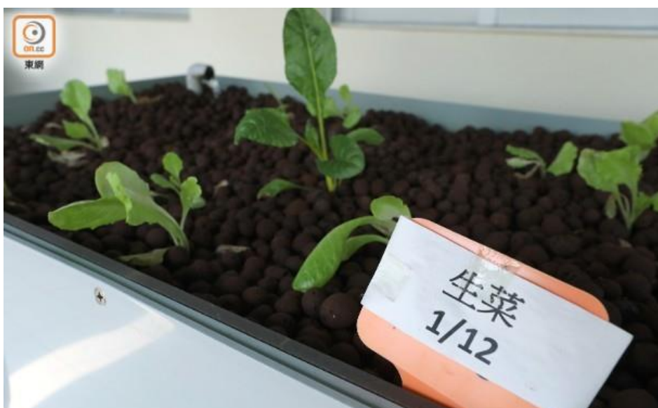
學校為每班分配「班田」，種植粟米、生菜等農作物。