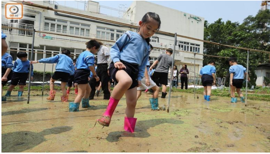
學生捲起褲管、穿上小水鞋踏入水田裏踩泥。(何量鈞攝)