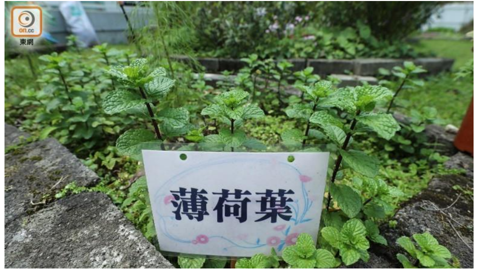
2 萬平方呎的農田內亦種有薄荷葉等香草植物。