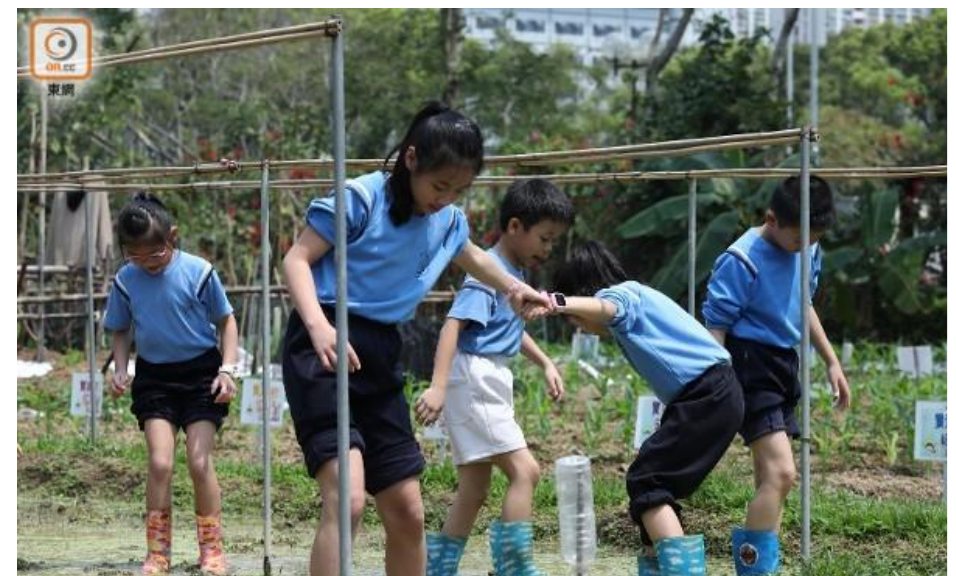
大埔舊墟公立學校(寶湖道)開發田園，讓學生化身小農夫落田耕種。